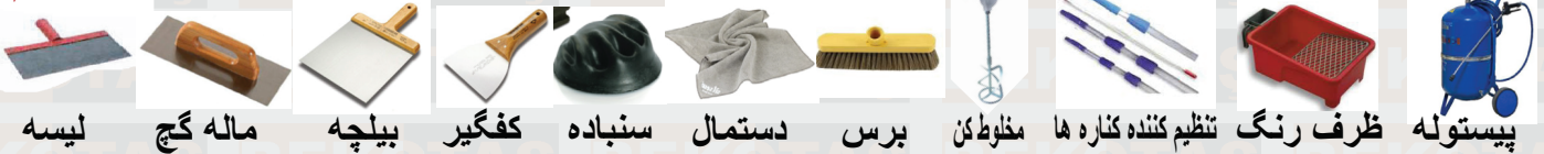
لیسه، ماله گچ، بیلچه، کفگیر، دستمال، برس، مخلوط کن، نظیم کننده کناره ها، ظرف رنگ، پیستوله