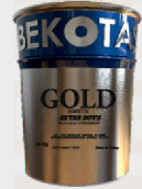
رنگ آسترگلد سنتتیک