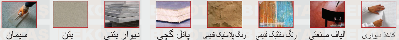
سیمان، بتن، دیوار بتنی، پانل گچی، رنگ پلاستیک قدیمی، رنگ سنتتیک قدیمی، الیاف صنعتی، کاغذ دیواری