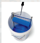
قبل از اجرا رنگ را خوب هم بزنید.