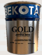
رنگ ضد زنگ سنتتیک گلد