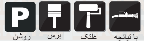
روشن برس غلتک با تپانچه