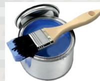
پس از رقیق کردن با ۱۰٪ آب، با قلم مو، رول و پیستوله میتوانید اجرا کنید.