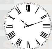
برای اجرای لایه های بعدی ۶ ساعت فاصله زمانی توصیه می شود.