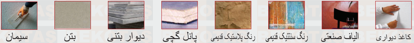
سیمان، بتن، دیوار بتنی، پانل گچی، رنگ پلاستیک قدیمی، رنگ سنتتیک قدیمی، الیاف صنعتی، کاغذ دیواری

• برای استفاده از روکش رنگی گلد لوکس توسط قلم مو، غلتک و پیستوله (پمپ) رقیق کرده و به خوبی مخلوط کنید. Gold Sentetik tiner را با ۰.۵٪ تینر سنتتیک سطوح آماده را سنباده زده و بعد از ۲۴ ساعت گلد لوکس را با فرچه غلتک و پیستوله (پمپ) بر روی سطوح استفاده کنید. در صورت نیاز به دو لایه رنگ باید بین اجرای لایه ها ۱ روز فاصله انداخته شود. ابزار آلات باید بلافاصله پس از استفاده با تینر تمیز شوند