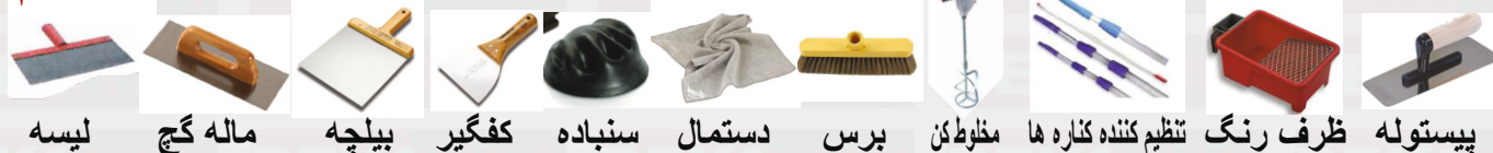
لیسه ماله گچ بیله کفگیر سنباده دستمال برس مخلوطکن تنظیم کننده کناره ها ظرف رنگ پیستوله