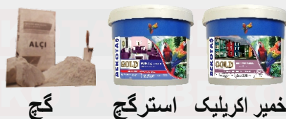
گچ استرگچ خمیر اکریلیک