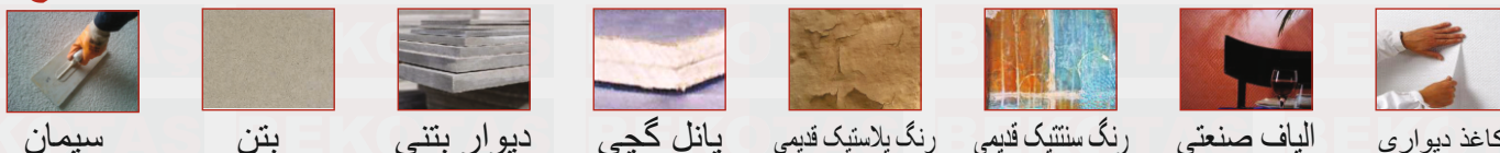
سیمان بتن دیوار بتنی پانل گچی رنگ پلاستیک قدیمی رنگ سنتنیک قدیمی الیاف صنعتی کاغذ دیواری

• برای به دست آوردن نتیجه بهتر از محصول نانو واش مات بعد از صاف کردن کلیه سطوح، استفاده از آستر داخلی نانو کلین باعث چسبندگی بهتر رنگ و نیز صرفه جویی در مصرف رنگ می شود. • قبل از استفاده محصول بر روی رنگ های قدیمی، باید سطوح کپک زده را با یک پارچه مرطوب کاملا تمیز کرده و سنباده کشیده و گرد و غبار را به طور کامل از بین برد. اگر لکه و کپک از خشک شدن، لکه کاملا بر طرف شود.