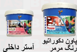
آستر داخلی پاون دکوراتیو رنگ مرمر