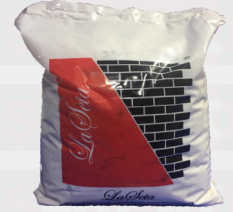
İPEK CANLI SIVA