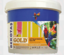
Gold Antibakteriyel İzolan