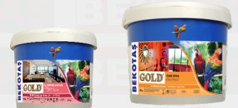
الذهب جام سيفا بطانة داخلية